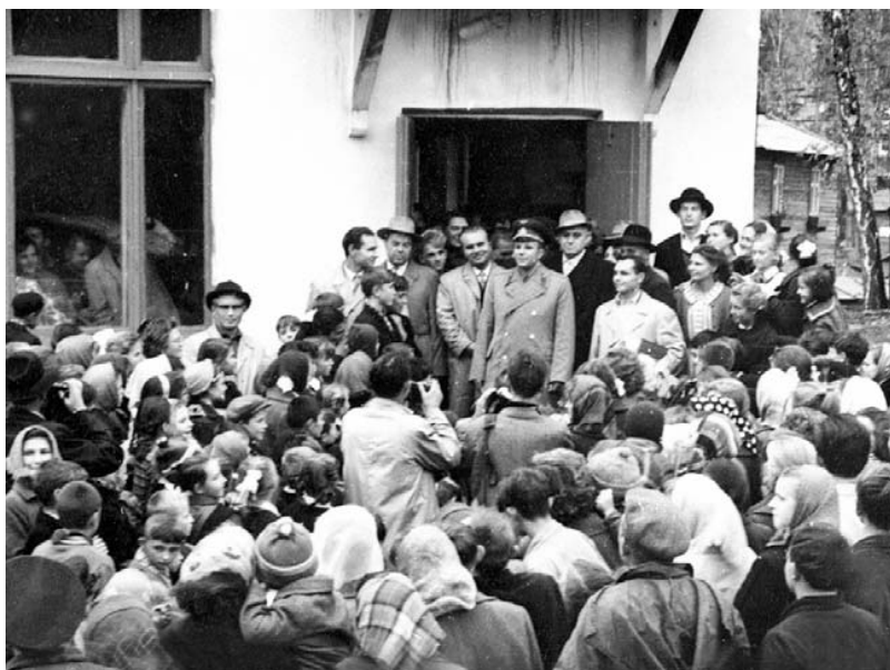
25 сентября 1963 год. Юрий Гагарин – гость нашей школы

Из котлована, в школу №2, Юрий Алексеевич Гагарин приехал к двум часам дня. Прошел сразу в мастерские, где была выставка дивногорских художников.