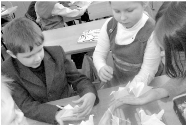
3 декабря 2014г. – юные гагаринцы мастерят журавликов

во всех войнах, на всех фронтах, и кого, к сожалению, не опознали при захоронении. Почтить светлую память тех, кто подарил нам чистое небо над головой, в Красноярском крае решили через акцию единого действия. Акция должна объединить всех в выполнении какого-либо действия. В нашей школе ученики начальных классов в этот день мастерили журавликов в технике оригами в память о погибших. Мы помним, значит, у нас есть будущее.