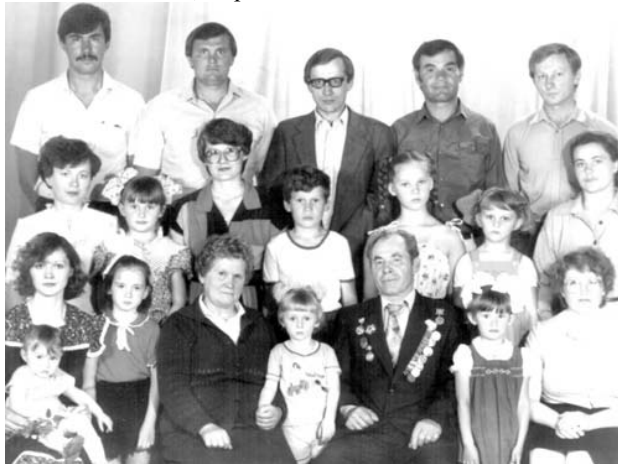
1986г. Дивногорск. В кругу семьи