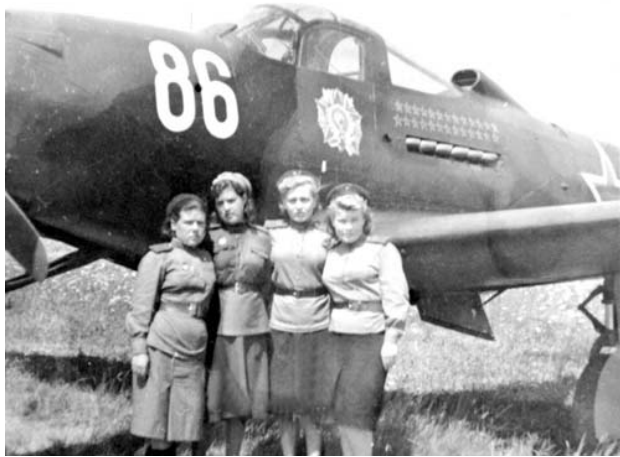
1945г. Австрия. Среди боевых подруг (вторая справа)