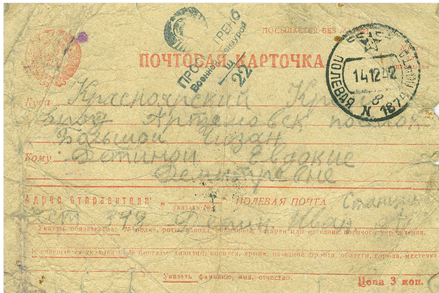
14 декабря 1942 года. Последнее письмо Ивана Дегина домой. Пропал без вести