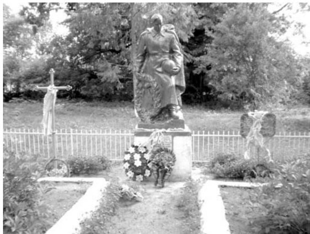
Братская могила в Облапах

Он был похоронен на Крестьянском кладбище села Дубово, затем перезахоронен в братскую могилу поселкового центра села Облапы Ковельского района Волынской области.