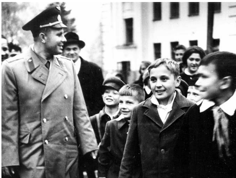
25 сентября 1963 год. Юрий Гагарин с учащимися школы №2

Затем Юрий Алексеевич с сопровождающими лицами прошёл к центральному входу, и все спустились по лестнице вниз, к дороге, где стояли машины. Ещё раз взмахнув, всем на прощание букетом, он уехал из нашей школы, ставшей единственной в Красноярском крае, которой посчастливилось встретить Гагарина, навсегда оставив всему коллективу чувство гордости за то, что посчастливилось пообщаться с великим человеком, и чувство ответственности за сохранение исторической памяти для всех последующих поколений об этой встрече.