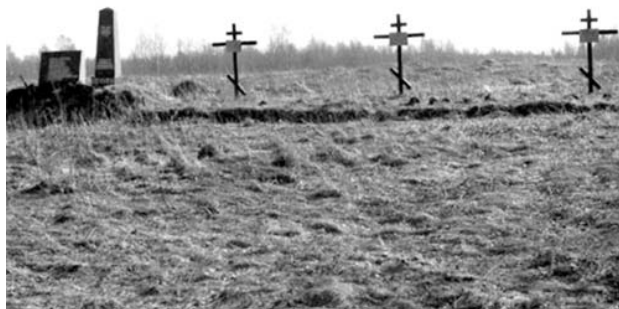
Ленинградская область. Гайтолово. Братская могила