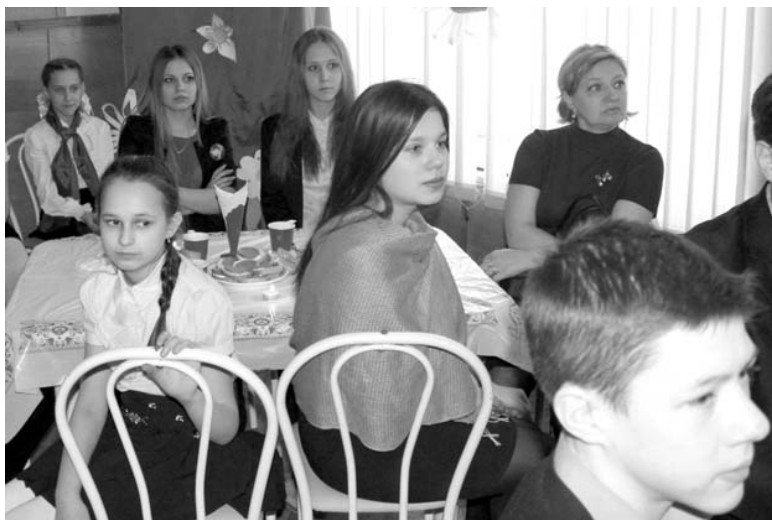
9 марта 2015г. – от всей души Юрию Алексеевичу Гагарину

8 марта 2015г. – в Миассе, на VII Зимней Спартакиаде учащихся России, ученик 9Б класса нашей школы Остап Авдиенко, выполнил норматив кандидата в мастера спорта по сноуборду.