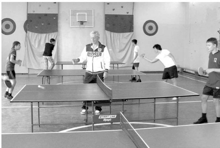
2 октября 2014г. – Кубок Ю.А. Гагарина по теннису