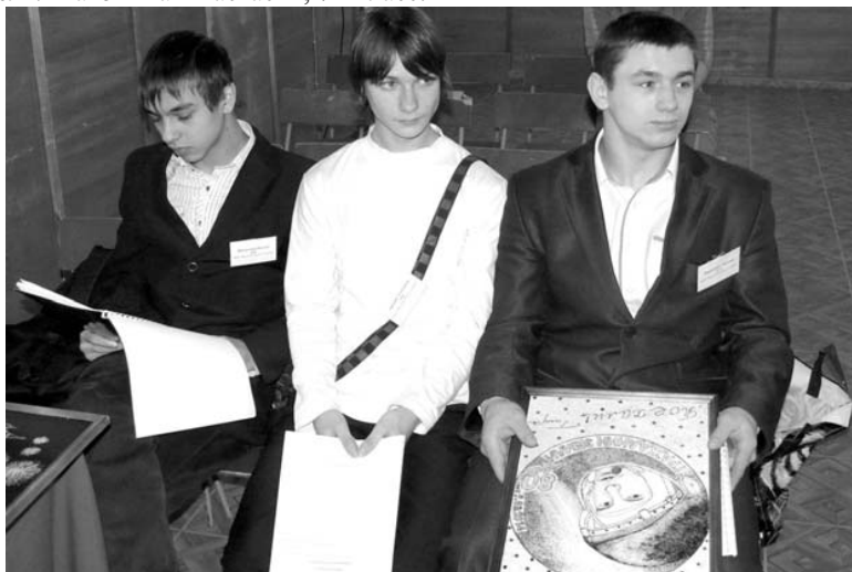
16 декабря 2014г. – победитель и призёры олимпиады по технологии