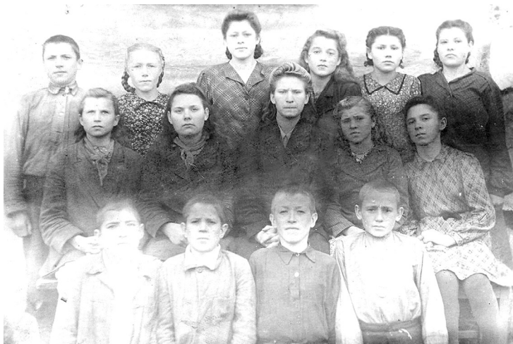
1950г. Верх-Мильтюши. 6 Б класс. Я, второй справа, в первом ряду

доставалось этой стороне и тумачков, и оскорблений и всего прочего. И всегда, конечно, побеждали бойцы и командиры Красной Армии.