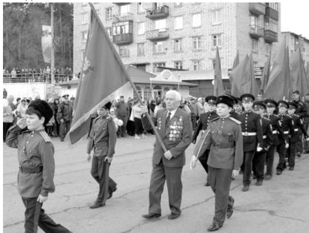
2010г. Дивногорск. Парад Победы

В 1982г., будучи директором Даурского лесхоза, переводится в Дивногорский лесхоз-техникум заместителем директора по производству. В 1985г. вышел на пенсию, но еще девять лет трудился в лесхоз техникуме, начальником штаба ГО, вахтером учебного корпуса. За добросовестный труд награжден двумя медалями.