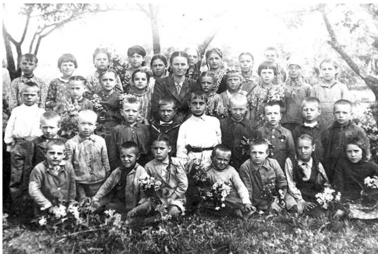
Мой первый класс. 1950г. Винницкая область, с. Раскопанное. Я стою крайний слева в белой рубашке

В Украине действительно был страшный голод. Вспоминаю, как я с братом, который был старше меня на 6 лет, сидим на русской печке, а в желудке пусто. Мама работала техничкой в школе. Прокормить на 30 рублей большую семью невозможно. Была весна. На поле возле нашего домика взошёл зеленый горошек. Мы по очереди в дождь ходили выковыривать горошек, чтобы утолить хоть как-то голод. Отец ездил по селам, чтобы хоть что-то привезти домой из продуктов.