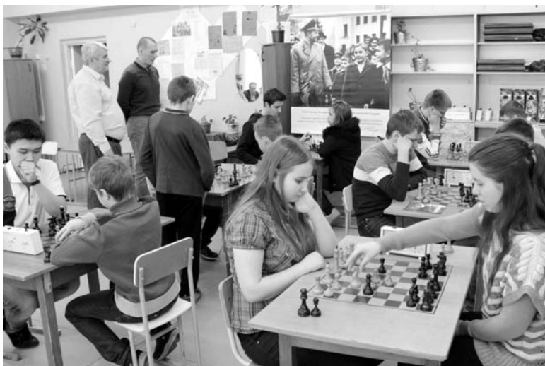
11 апреля 2015г. – в игре участники II Регионального шахматного турнира среди школьников Красноярского края «Гражданин Земли»