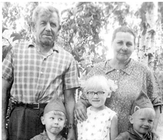
Скоково Ярославской области. Я в гостях у дедушки и бабушки