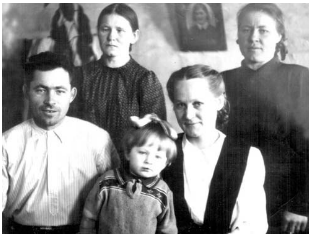
1953 год. Я с папой и мамой