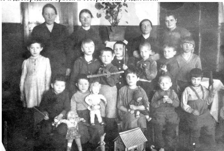
Вот они – детсадовцы военных лет. 1946г. Омская область, Павлоградский район, с. Дувановка. Я сижу в первом ряду, второй справа