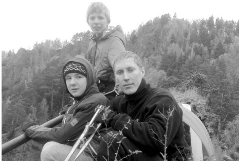
21 сентября 2014г. – вот они отважные гагаринцы, водружают на скалах флаг Родины