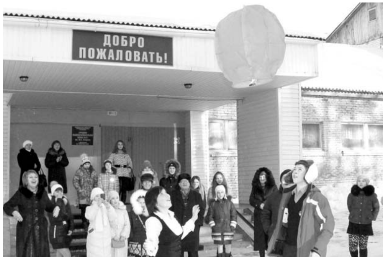
9 марта 2015г. – воздушный змей уносит в небо наши желания