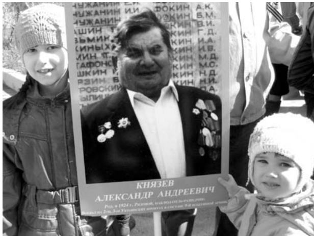
9 мая 2014г. Дивногорск. Я с прадедущкой в Бессмертном полку

После демобилизации вернулся в с. Езагаш. С 1957г. жил в п. Овсянка, работал плотником Красноярскгэсстроя, затем – сплавщиком Слизневской сплавконторы.