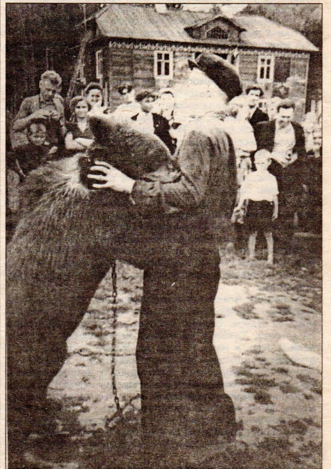
В 1950-е годы родственники комсомольцев, уезжающих в Сибирь на строительство Красноярской ГЭС, с ужасом — иногда с поддельным, а порой и с искренним, восклицали: "Куда же ты собрался, там ведь медведи по улицам ходят!" Медведи, конечно, у нас по улицам не гуляли, но периодически дивногорцы имели с ними дело. Мы публикуем достаточно известную фотографию и обращаемся к вам, уважаемые старожилы, с просьбой: если кто-то помнит, где, когда был сделан этот снимок, кто, кроме медведя, на ней запечатлен, — сообщите, пожалуйста, в городской музей или в газету "Огни Енисея" для "Краеведа".