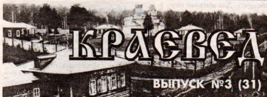
СТРАНИЦА ПОДГОТОВЛЕНА ДИРЕКТОРОМ ДИВНОГОРСКОГО ГОРОДСКОГО МУЗЕЯ ИГОРЕМ ФЁДОРОВЫМ