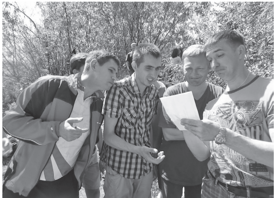
В совете вынашивают идеи по возрождению конкурсов профессионального мастерства и организации обучения и повышения квалификации персонала

99181 — для пенсионеров, ветеранов ВОВ, бывших узников концлагерей, жертв незаконных политических репрессий, ветеранов и инвалидов боевых действий в Чечне и Афганистане, ликвидаторов чернобыльской аварии, инвалидов I и II групп; 99183 — для индивидуальных подписчиков. Подписка через online-каталог www.vipishi.ru