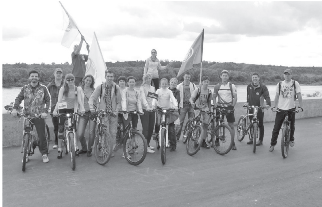
Самыми массовыми остаются спортивные мероприятия, в которых принимают участие и молодёжь и старшее поколение сотрудников компании