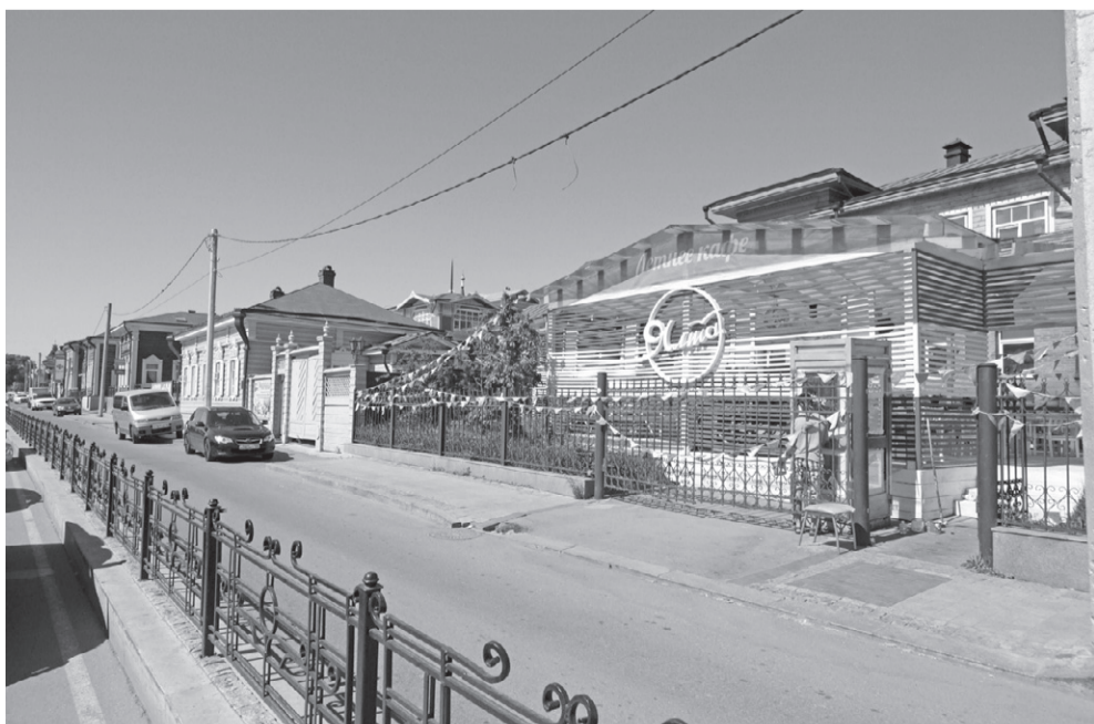
Некоторые постройки в 130 квартале сильно выбиваются из заданного архитекторами стиля сибирского деревянного зодчества

Сейчас уже сложно представить, что на развилке улиц Седова и 3 Июля в своё время вместо привычных домиков «Иркутской слободы» мог появиться высотный жилой комплекс. Такая перспектива была вполне реальна, но осенью 2010 года тогдашний губернатор Дмитрий Мезенцев предложил к 350-летию Иркутска идею реконструировать квартал, на тот момент застроенный преимущественно зданиями барачного типа. Проект по восстановлению историко-архитектурной среды был создан за рекордные полгода. Основное строительство заняло и того меньше — уже в сентябре 2011 реконструкция считалась завершённой: была возведена большая часть деревянных домов и сделано благоустройство, чтобы открыть квартал для горожан к празднику. Другие объекты, например, ТРК «Модный квартал», появились позже, некоторые строительные работы на участке ведутся до сих пор.