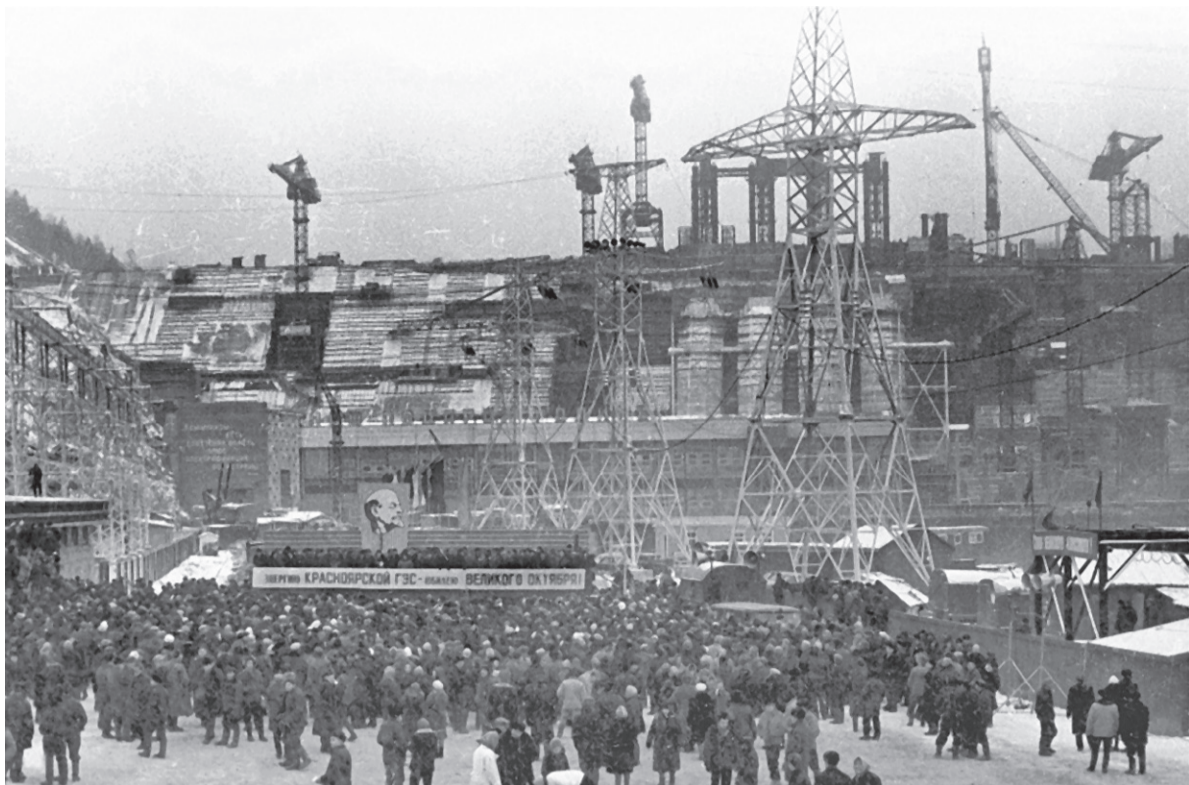
Митинг в день пуска первого агрегата Красноярской ГЭС 3 ноября 1967 года

Прошло более 40 лет. Изменилось всё: люди, город, государство, в котором живём. Мы выросли сами и даже успели вырастить своих детей. Но вот что удивительно: я по-прежнему уверен, что материальным воплощением надёжности является наша плотина, а о своих родителях с той же гордостью говорю: «Они – строители Красноярской ГЭС». И за всем этим незримо стоит колоссальный труд людей, объединённых коротким, но ёмким словом – «КрасноярскГЭСстрой». Красноярскгэсстроевцы не только возвели жемчужину советской гидроэнергетики – Красноярскую ГЭС, но и построили город Дивногорск. За плечами «КрасноярскГЭСстрой»