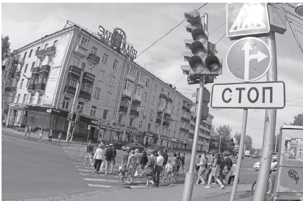
Отсутствие управления может остановить развитие 130 квартала, который рискует потерять свою репутацию