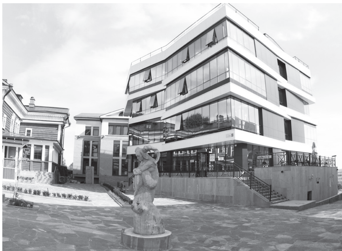
Пока ресторанный и бизнес-недвижимость по-прежнему привлекают внимание арендаторов, офисы в 130 квартале всё ещё ждут своих постояльцев

Правда, в итоге некоторые объекты все равно «переметались». Такая судьба постигла медцентр, который сейчас превращается в кафе, офисный центр, где появился ресторан «Маленькая Азия». Пустующая ниша в итоге была занята другим офисным зданием, выросшим прямо за «Модным кварталом». Оно, как и многие недавно появившиеся постройки на территории «Иркутской слободы», несколько выбивается из общего ландшафта. Сможет ли застройщик окупить ожидания застройщика, пока непонятно. Арендная стоимость там пусть немного, но выше, чем в целом