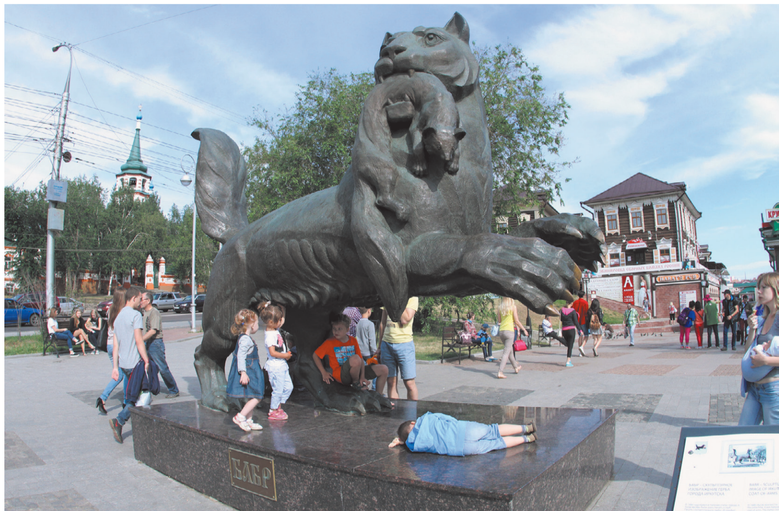
За четыре года после открытия 130 окончательно обжился, став одним из главных городских центров притяжения

Почему инвесторы 130-го квартала опасаются за будущее иркутского реконструированного комплекса